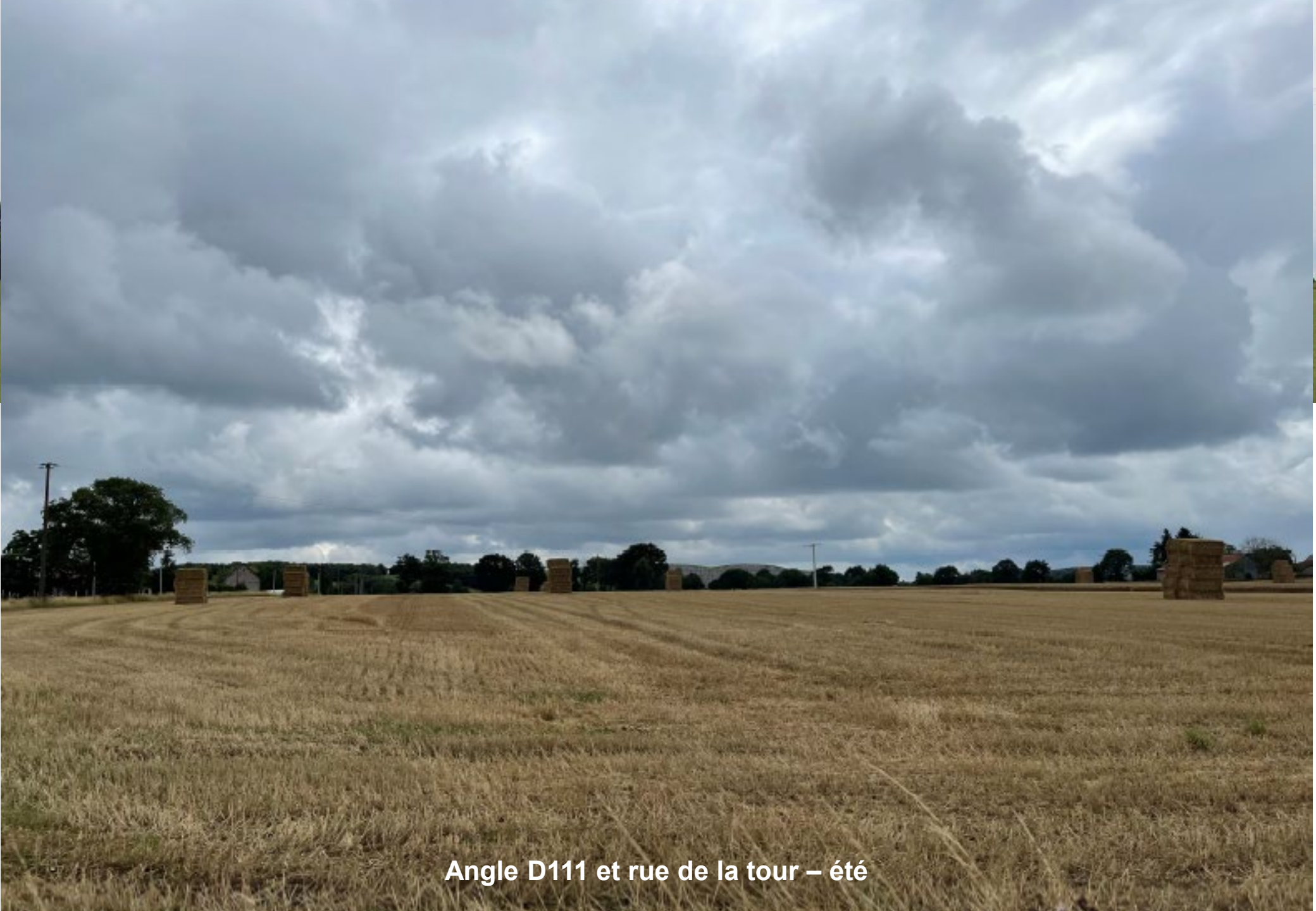
Angle D111 et rue de la tour – été