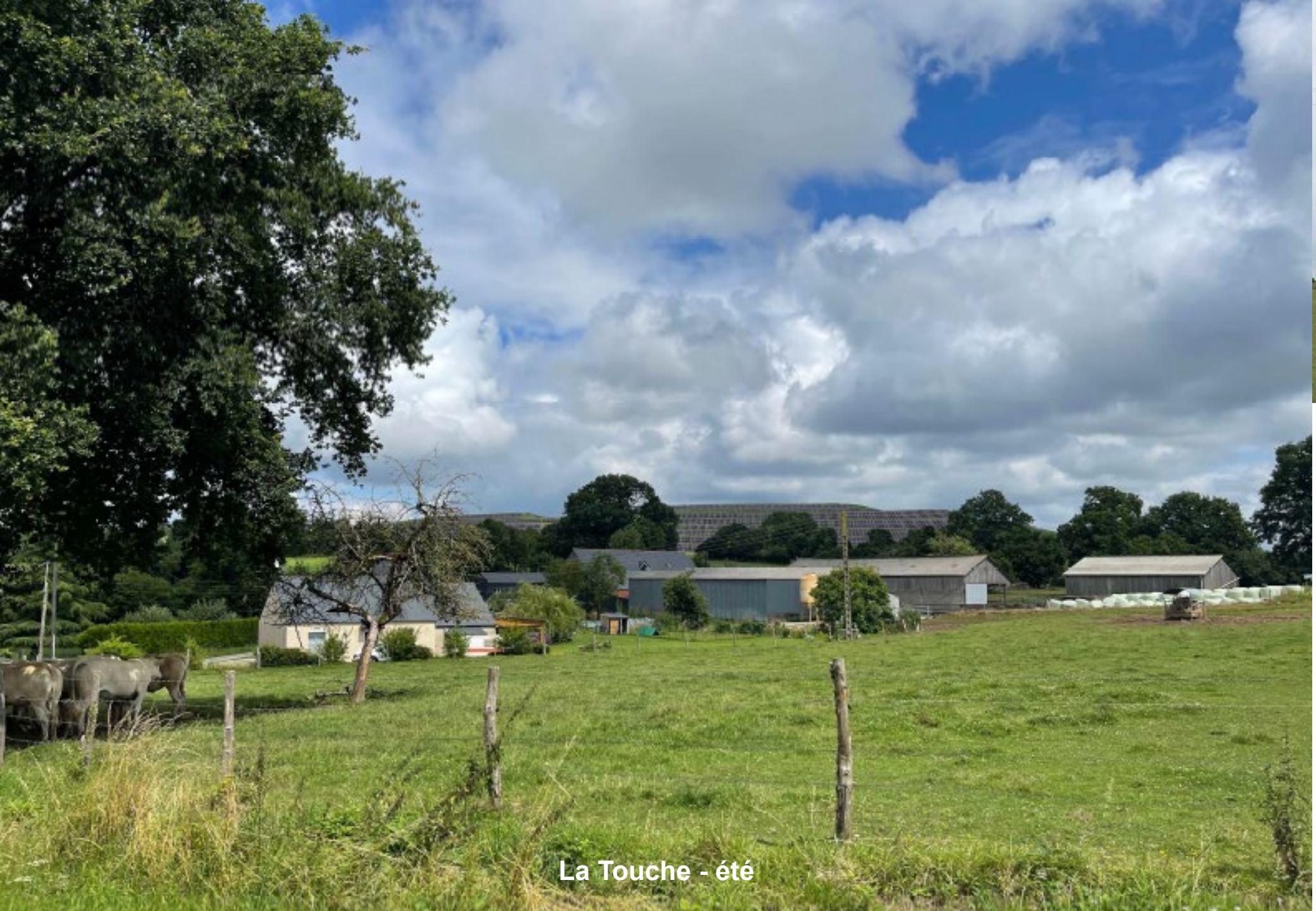
La Touche - été