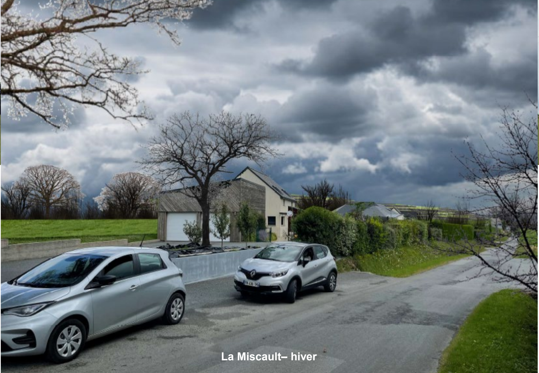
La Miscault- hiver