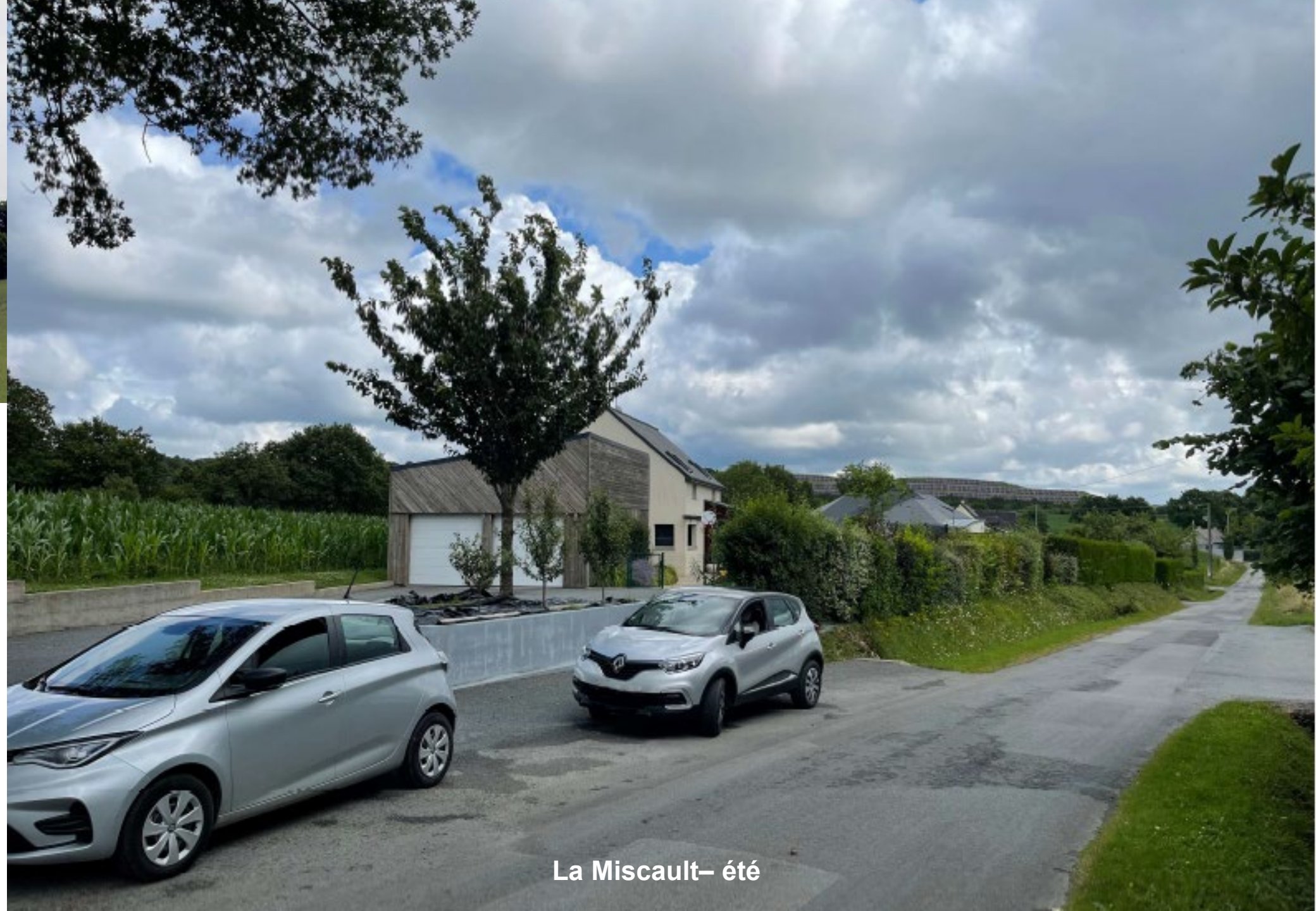
La Miscault- été