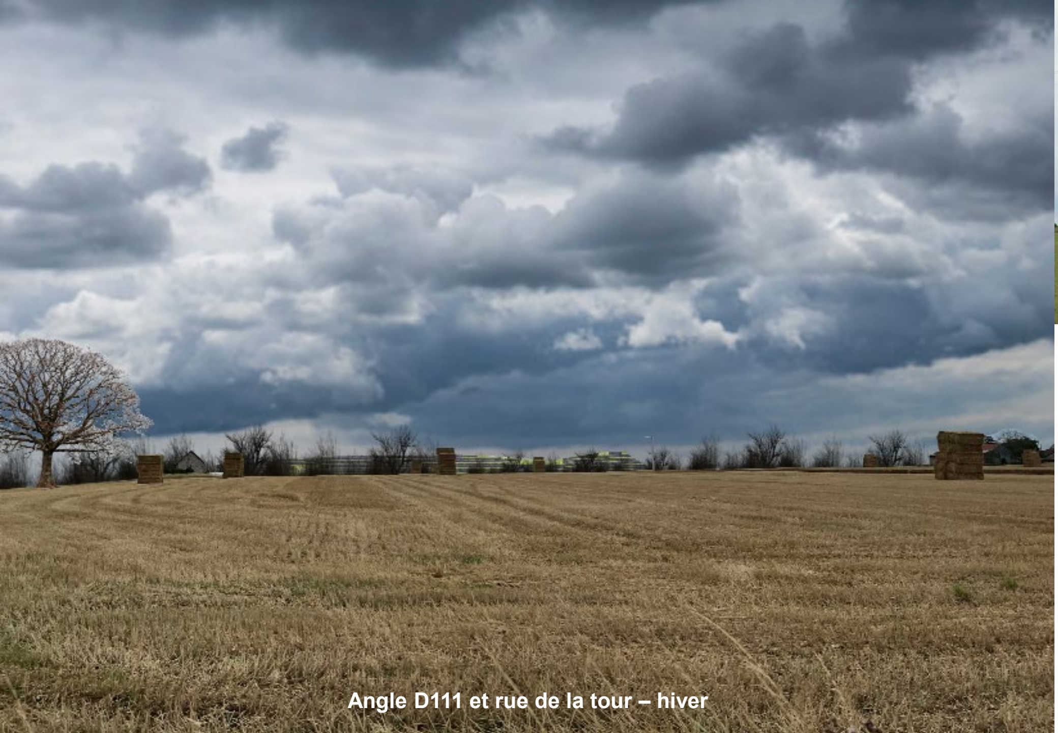
Angle D111 et rue de la tour – hiver