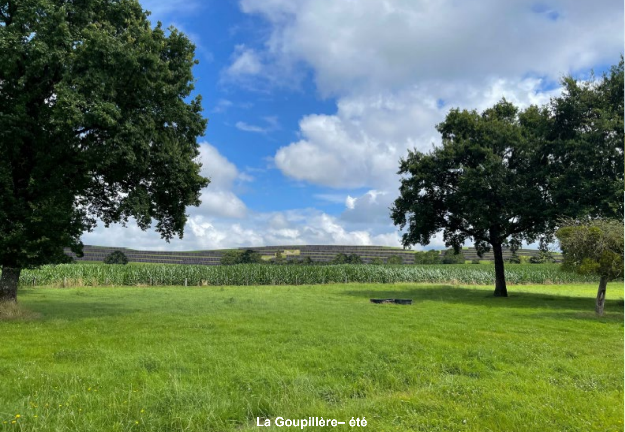
La Goupillère— été