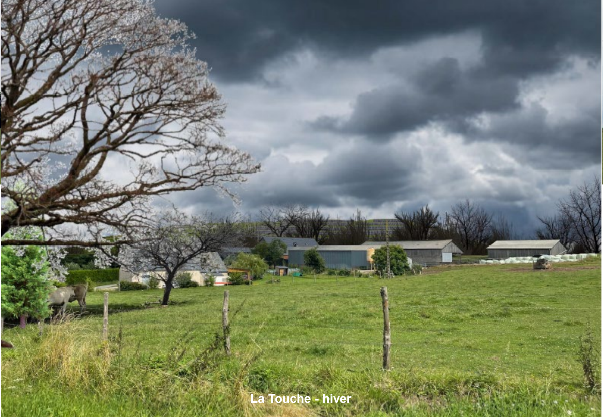
La Touche - hiver