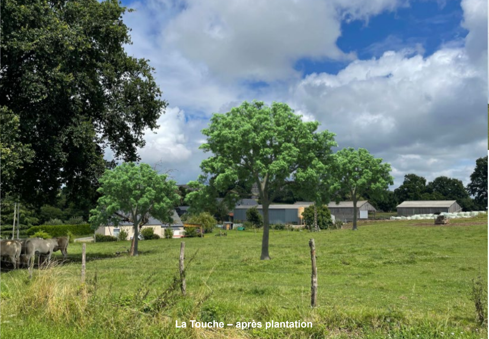
La Touche – après plantation