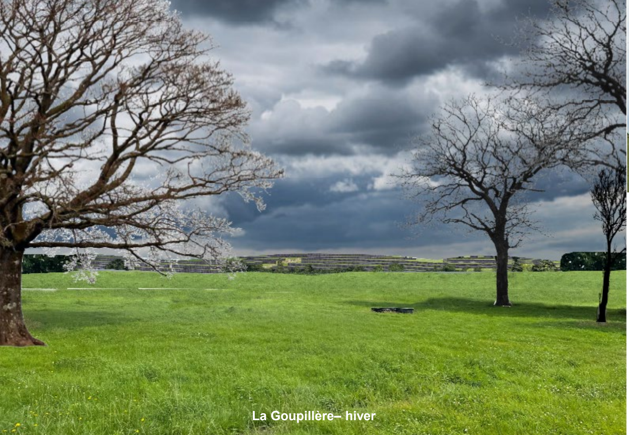
La Goupillère— hiver